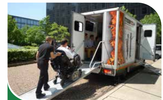
Accessibilité aux Personnes à Mobilité Réduite