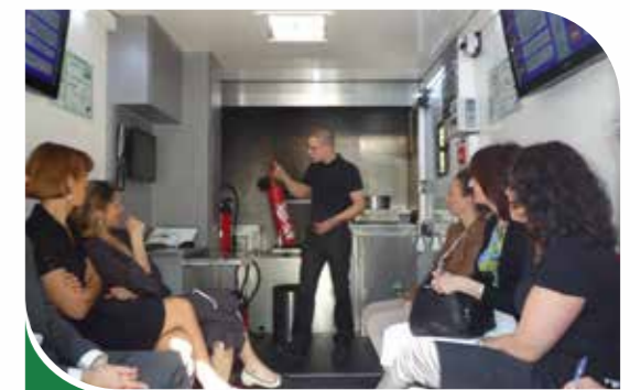
Salle de formation conviviale