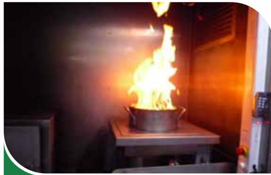
Feu de friteuse