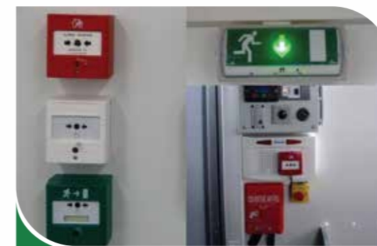
Déclencheurs manuels et BAES