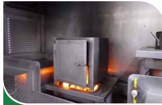
Feu d'armoire électrique