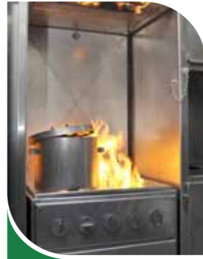
Feu de cuisine