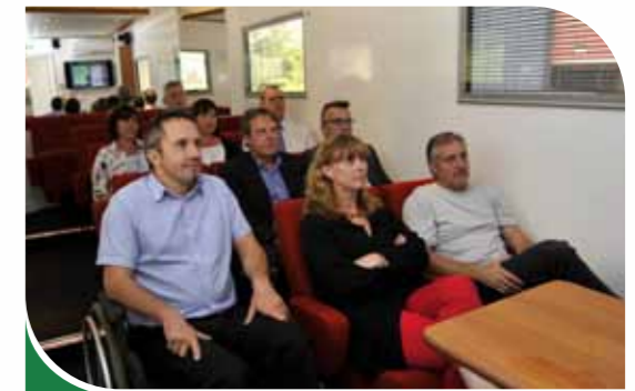
Salle de formation de haut standing