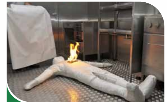
Feu de personne