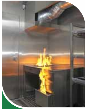
Feu de bureau