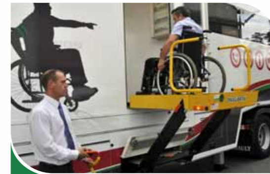
Accessibilité aux Personnes à Mobilité Réduite