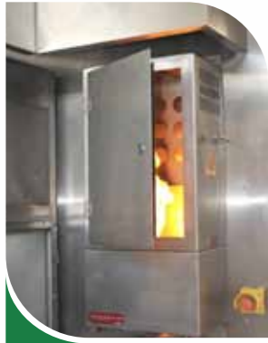
Feu d'armoire électrique