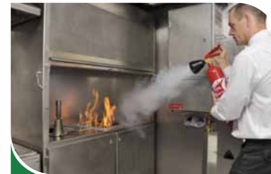
Feu de laboratoire