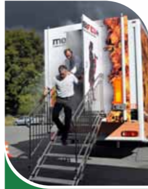
Evacuation d'une zone enfumée