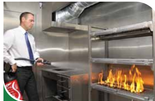
Feu de stockage