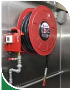
Robinet d'incendie armé